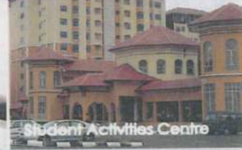
Student Activities Centre